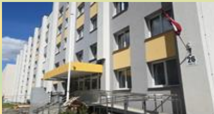
18. novembra ielā 354V